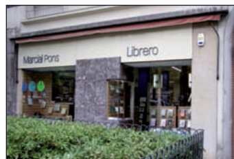
Marcial Pons. Libros de Humanidades Plaza del Conde del Valle Suchil, 8. Madrid