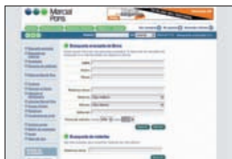
Motor de búsqueda avanzada de la página web www.marcialpons.es