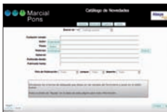
Motor de búsqueda avanzada del servicio Marc 21 de Marcial Pons Librero http://marcialpons.absysnet.com

55 años avalan la experiencia de Marcial Pons en el mercado del libro extranjero. En la actualidad mantiene relaciones comerciales con todas las grandes y más importantes editoriales de Europa y América. Al mismo tiempo, bien consolidadas estas relaciones, Marcial Pons está haciendo de puente entre Europa y América, canalizando un buen número de peticiones de clientes americanos para libros europeos.