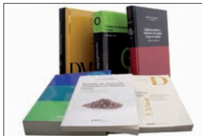
Algunas de las colecciones editadas por Marcial Pons Ediciones Jurídicas y Sociales