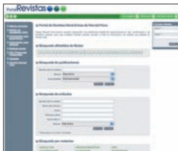
Plataforma de revistas digitales http://revistas.marcialpons.es

Una vez efectuada la búsqueda, el usuario puede suscribirse a la revista, comprar un número completo o comprar un artículo concreto, y puede acceder desde cual-