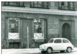
Marcial Pons Libros Jurídicos Madrid, 1970

En respuesta a las crecientes necesidades logísticas, en el año 1995 Marcial Pons instaló sus oficinas centrales y almacenes en un edificio propio para uso exclusivo de las empresas del