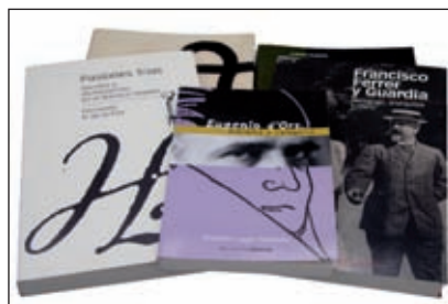
Algunas de las colecciones editadas por Marcial Pons Historia

En el año 2007 funda una nueva editorial, “ Marcial Pons Argentina ” con sede en Buenos Aires, con la idea de difundir la cultura jurídica iberoamericana en dicho continente y en el resto del mundo.