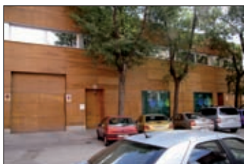
Marcial Pons. Oficinas centrales C/ San Sotero, 6. Madrid