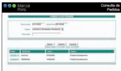
Consulta de pedidos a través de la extranet