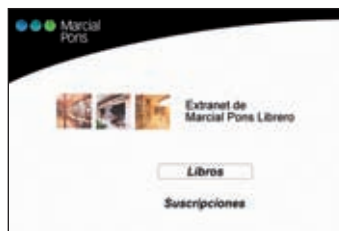
Extranet de Marcial Pons http://clientes.marcialpons.es