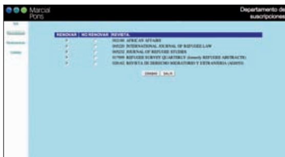
Renovación de las suscripciones a través de la extranet

Marcial Pons ha desarrollado una Extranet para los clientes con suscripciones a revistas, con el fin de que, desde una sola página web, puedan realizar cualquier operación relacionada con sus suscripciones como: