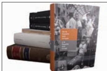
Libros distribuidos por Marcial Pons

ANABAD (MADRID). ANABAD (CASTILLA-LA MANCHA). ÁNGEL RIESCO TERRERO. ASOCIACIÓN ESPAÑOLA DE FUNDACIONES. AYUNTAMIENTO DE POZOBLANCO. AYUNTAMIENTO DE BENAVENTE. CASA DE VELAZQUEZ. CÁTEDRA PRASA DE EMPRESA FAMILIAR. CENTRO CULTURAL CONDE DUQUE. CENTRO DE ESTUDIOS E INVESTIGACION SAN ISIDORO. CENTRO DE ESTUDIOS POLÍTICOS Y CONSTITUCIONALES. CENTRO DE INVESTIGACIÓN Y ESTUDIOS REPUBLICANOS. CENTRO DE ESTUDIOS SUPERIORES ESPECIALIDADES JURIDICAS. CENTRO DE ESTUDIOS Y DOC. DE LAS BRIGADAS INTERNACIONALES. CENTRO PARA LA EDICIÓN DE CLÁSICOS ESPAÑOLES. CIUDAD AUTONOMA DE MELILLA. COLEGIO DE REGISTRADORES DE LA PROPIEDAD Y MERCANTILES DE ESPAÑA CONSEJO GENERAL DEL NOTARIADO. CONSEJO GENERAL DEL PODER JUDICIAL. CORTES DE CASTILLA Y LEÓN. EDITORIAL LETE. ESADE. FAJARDO EL BRAVO. FERNANDO GUTIERREZ LASO. FORO PARA EL ESTUDIO DE LA HISTORIA MILITAR EN ESPAÑA. FUNDACIÓN COSO. FUNDACION CULTURAL CANTERA-BURGOS FUNDACION DEMOCRACIA Y GOBIERNO LOCAL. FUNDACIÓN ENSEÑANZA SUPERIOR A DISTANCIA. FUNDACIÓN ESPAÑOLA DE HISTORIA MODERNA. FUNDACIÓN INSTITUTO CASTELLANO Y LEONÉS DE LA LENGUA. FUNDACIÓN GARCIA AREVALO. FUNDACIÓN JUANELO TURRIANO. FUNDACIÓN LARGO CABALLERO. FUNDACIÓN LEBREL BLANCO. FUNDACION PI I SUNYER. FUNDACIÓN RAMÓN MENÉNDEZ PIDAL. FUNDACIÓN SAN MILLÁN DE LA COGOLLA. FUNDACION SÁNCHEZ-ALBORNOZ. FUNDACIÓN SAPERE AUDE. GLOBAL LAW PRESS. INSTITUTO DE CIENCIAS POLITICAS Y SOCIALES. INSTITUTO DE CONTABILIDAD Y AUDITORIA DE CUENTAS. INSTITUTO DE DERECHO PÚBLICO.