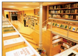
Marcial Pons Llibreters. Libros Jurídicos, económicos y de empresa C/ Provença, 249-251. Barcelona