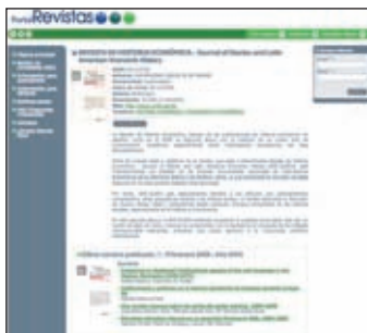
Ficha de revista de la plataforma de revistas digitales de Marcial Pons