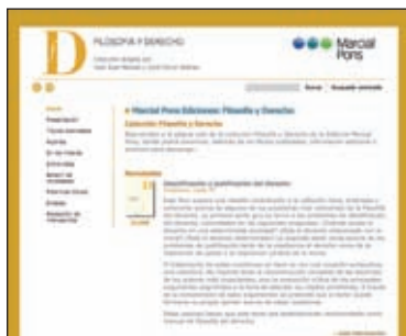
Página web de la colección filosofía y derecho http://www.filosofiyderecho.es