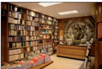
Marcial Pons. Libros Jurídicos C/ Bárbara de Braganza, 8. Madrid