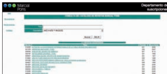
Consulta del catálogo de Revistas, a través de la extranet