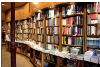
Marcial Pons. Libros de Economía y Empresa Plaza de las Salesas, 10. Madrid