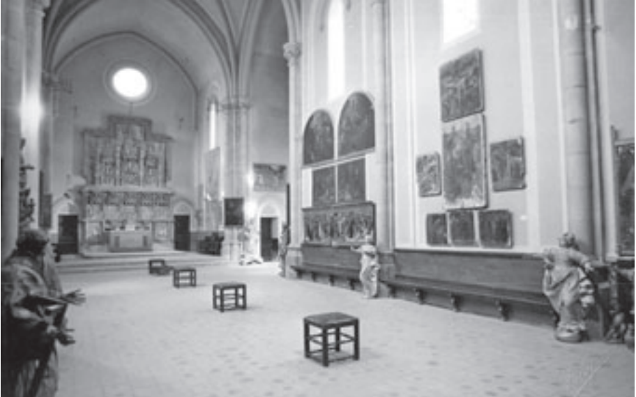
Fig. 1. Vista del interior Museo Episcopal y Capitular de Arqueología Sagrada antes de su última renovación.

los museos se convierten en grandes centros culturales, artísticos y polivalentes, una especie de nuevos templos, donde los arquitectos, los gobiernos y las ciudades compiten. Muchos de ellos, de fundación antigua, se modernizan, se amplían y se transforman en este momento. Se comienza a plantear su valor como empresas dentro de la industria cultural, que va ganando fuerza y se convierte en producto de consumo, generador de riqueza y de impacto económico y social.