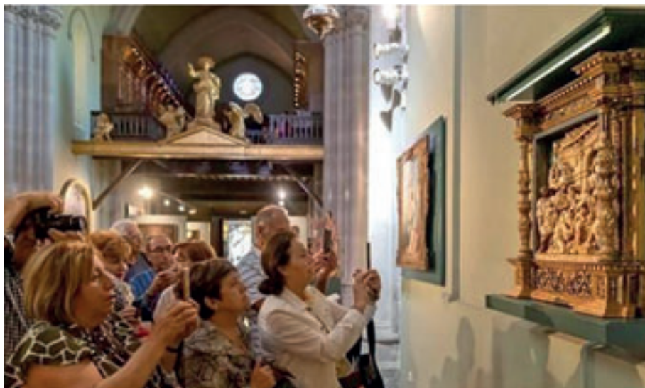
Fig. 2. Visitantes del Museo Diocesano de Huesca admirando una de las piezas más singulares de la colección.

Conviene aprovechar el momento en que se toma contacto directo con todo ello a través de la visita a un museo o monumento [fig. 2]. Es la ocasión de captar la atención, de motivar y utilizar las herramientas que tenemos a nuestro alcance para introducir conceptos complejos.