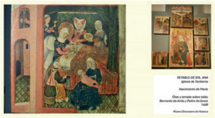
Fig. 3. Nacimiento de María, Retablo de Santa Ana de la iglesia de Tardienta, por Bernardo de Arrás y Pedro de Zuera, 1449. Fuente: Museo Diocesano de Huesca.

Para conseguir todo ello es importante enseñar a mirar, dirigir la mirada del espectador, ir al detalle, mostrar los matices y las sutilezas y presentar los objetos de forma transversal, según los intereses del visitante y las propuestas del propio museo, ir desvelando los distintos niveles de lectura.